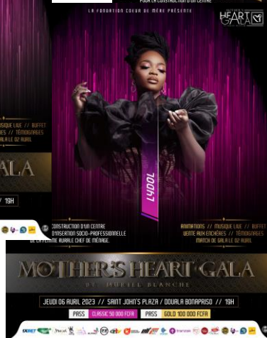
Lydol La Slammeuse