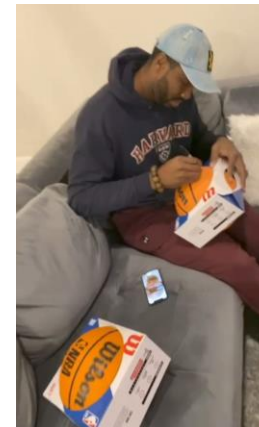
Ballons signés par Luc Mbah A Mouté , Basketteur Camerounais de la NBA, pour la vente aux enchères